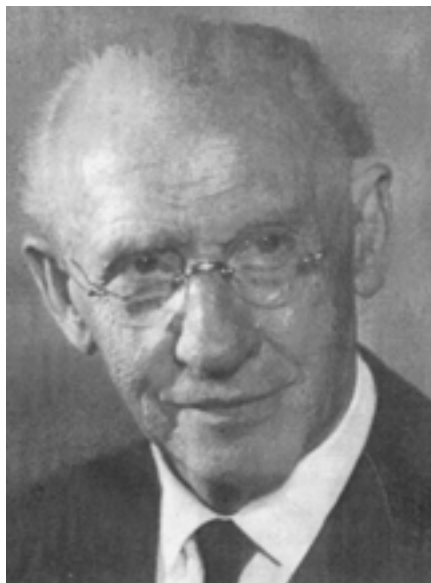
Thoraxkirurgen Clarence Crafoord.

Professor Crafoord var en mycket omtyckt läkare, såväl bland patienter som bland personal. Han kände till namnet på all personal och var mycket