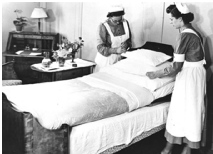
Inredningen i patientrummen var exklusiv men praktisk. Allt var inköpt på NK.

Sjukhuset var toppmodernt när det invigdes. Här en interiörbild från laboratoriet.