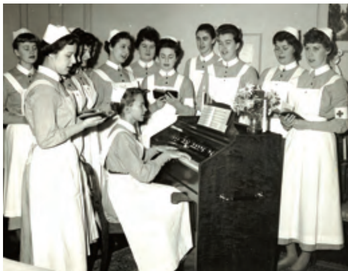
Sjuksköterskeeleverna bodde två och två på elevhemmet och hade dessutom tillgång till ett allrum där de ofta umgicks, till exempel som här med sågstunder.

Patienterna valde själva att bli behandlade på privatsjukhuset och var beredda att betala för den extra kom-