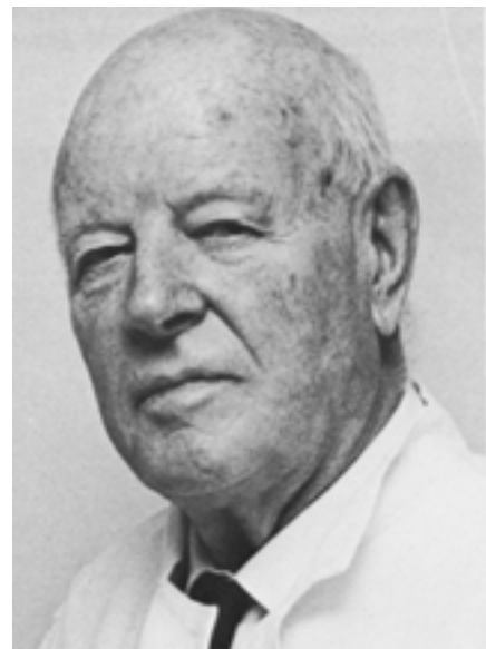
Neurokirurgen Herbert Olivecrona.

Professor Olivecrona var en internationellt ledande hjärnkirurg som gjorde särskilt stora insatser för den kirurgiska behandlingen av hjärntumörer och kärlmissbildningar i hjärnan. Hans internationella renommé gjorde honom eftersökt också bland utländska patienter. Många av dessa opererades på Röda Korsets sjukhem, men han var även ofta utomlands för att utföra operationer på